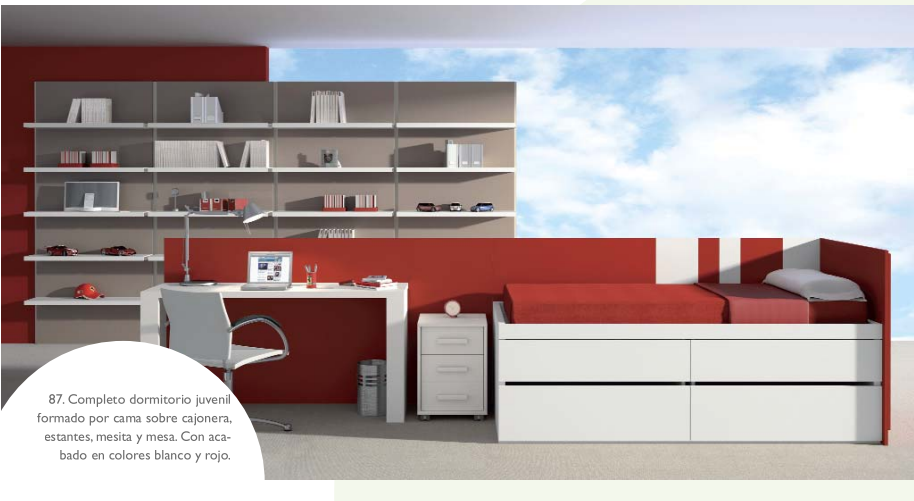
87. Completo dormitorio juvenil formado por cama sobre cajonera, estantes, mesita y mesa. Con acabado en colores blanco y rojo.