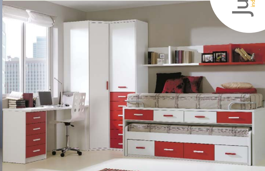
90. Soluciones a cualquier espacio con este dormitorio juvenil. Acabado en colores blanco y rojo. Medidas: 240 x 331 cm.