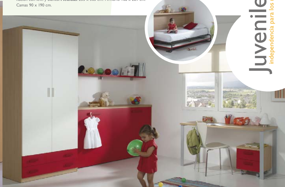
78. Dormitorio juvenil perfecto para espacios reducidos ya que la cama es abatible ofreciéndonos un espacio extra cuando nos haga falta. Acabado en colores haya noble, rojo y blanco. Medidas: 46 (cama cerrada) 125 (cama abierta) x 306 cm. Armario 102 x 229 cm. Escritorio 152 cm.

Juveniles independencia para los más jóvenes