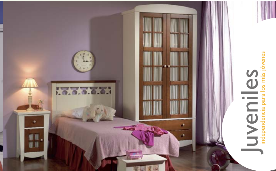
70. Los colores cerezo y hueso se combinan en este dormitorio rústico, fabricado en madera maciza. El cabecero con moldura de estrella para cama de 90 cm. también está disponible en 105 cm. Medidas: Cabecero 117 x 108 cm. Mesita 45 x 68 x 37 cm. Armario 106 x 226 x 56 cm.