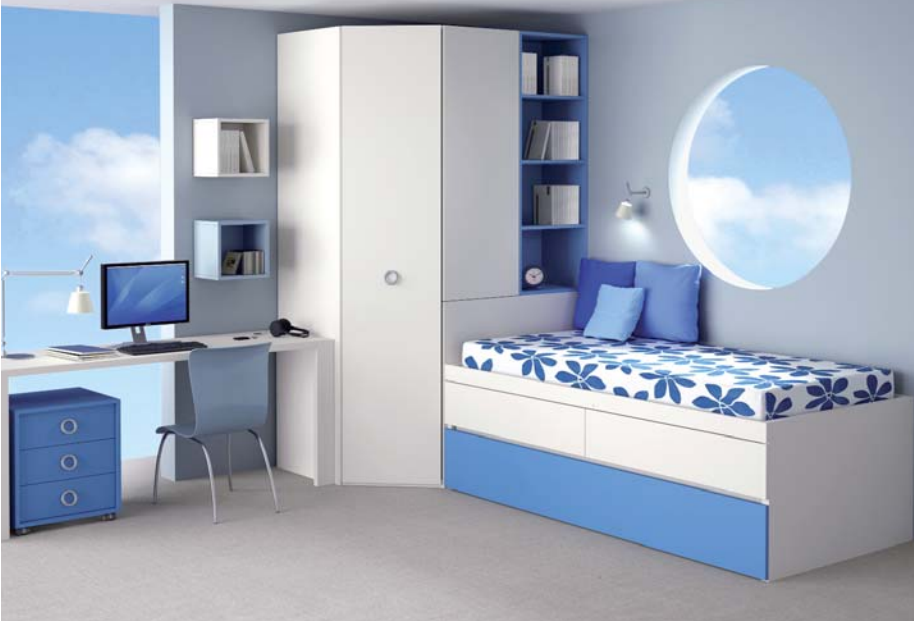
88. Dormitorio compacto formado por dos camas armario, cabecero, mesa de estudio y cajonera que combina el blanco y azul.

Juveniles independencia para los más jóvenes