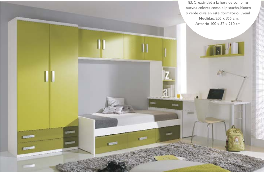
83. Creatividad a la hora de combinar nuevos colores como el pistacho, blanco y verde oliva en este dormitorio juvenil. Medidas: 205 x 355 cm. Armario 100 x 52 x 210 cm.