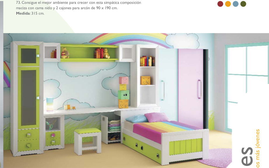
73. Consigue el mejor ambiente para crecer con esta simpática composición maciza con cama nido y 2 cajones para arcón de 90 x 190 cm. Medida: 315 cm.