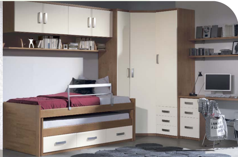
85. Actual dormitorio juvenil con acabado en chapa que combina de manera acertada detalles en aluminio y pino macizo. Medidas: 300 x 325 cm. Camas 90 x 190 cm. y 90 x 180 cm.