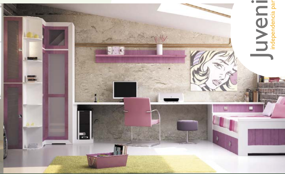
74. Actual y dinámico dormitorio juvenil macizo con cama nido y dos cajones para arcón de 90 x 190 cm. Medida: 366 cm.

Juveniles independencia para los más jóvenes