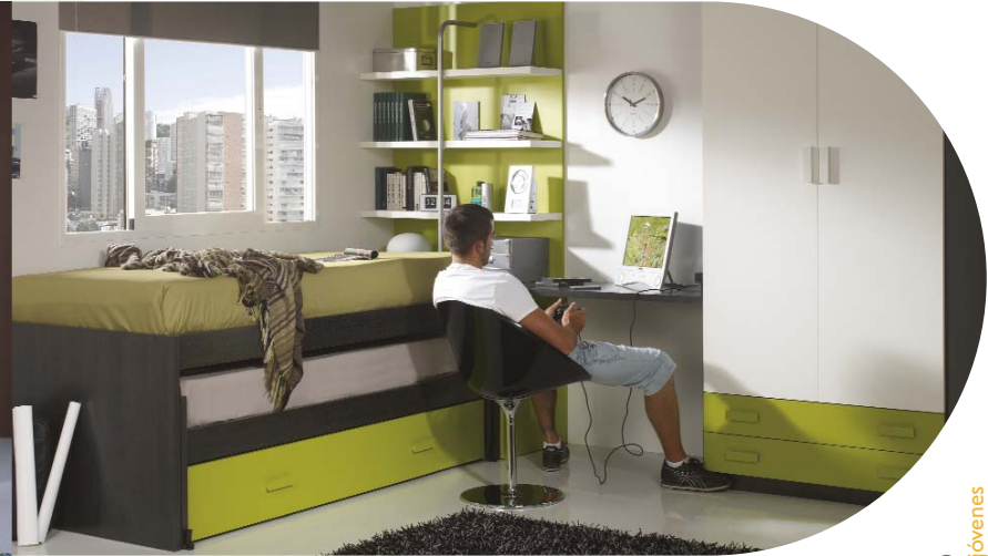
77. Juvenil aspecto para este dormitorio con acabado en colores acero en combinación con kiwi y blanco. Medidas: 255 x 305 cm. Armario 102 x 229 cm. Camas 90 x 190 cm.