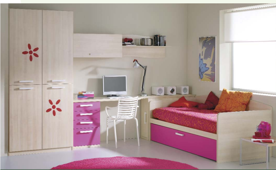
72. Alegre dormitorio juvenil con acabado en colores abedul y fucsia. Medidas: 352 x 230 cm.