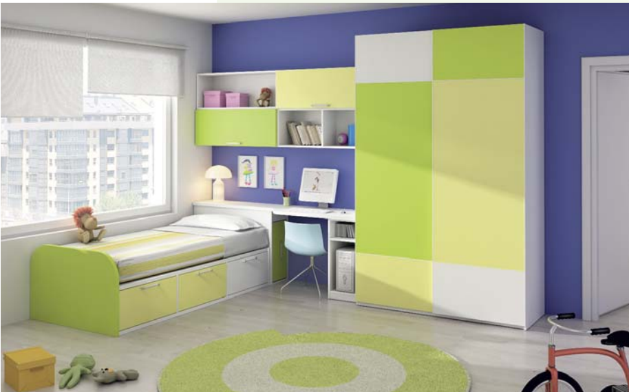
68. Juvenil estilo moderno fabricado en colores blanco, limón y verde manzana, con tirador en hierro. Medidas: 232 x 368 cm. Armario 160 x 237 cm. Cama 90 x 190 cm.