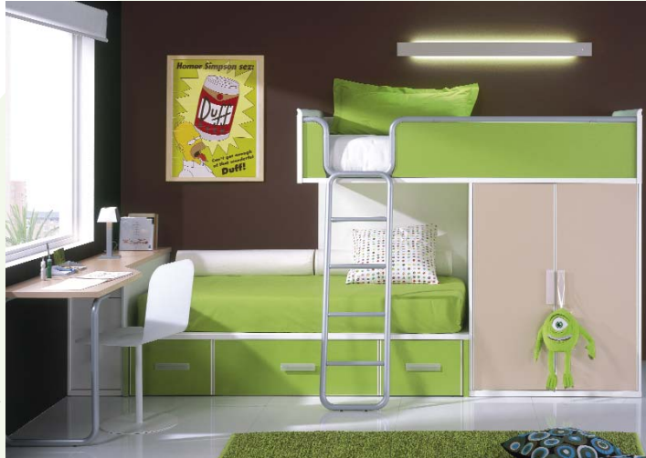
75. Dormitorio compacto con acabado en color blanco, arena, menta y detalles de tiradores en glas blanco. Medidas: 200 x 335 cm.