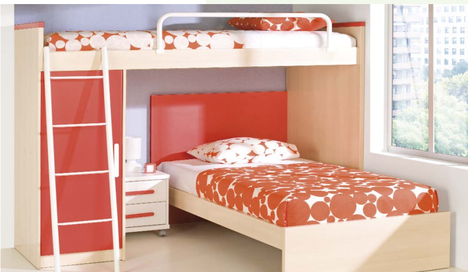
84. Dormitorio juvenil muy recomendado para obtener los mejores resultados de distribución en espacios reducidos. Acabado en colores abedul, blanco y carmín. Medidas: 205 x 206 cm. Camas 90 x 190 cm.