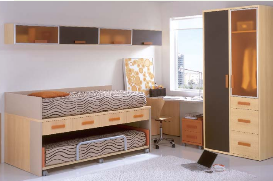
76. Dormitorio juvenil que permite adaptar la mesa a diferentes medidas para proponer la solución más cómoda a cada espacio. Acabado en colores haya, arena, marrón, mandarina y tiradores en Glass mandarina. Medidas: 330 x 250 cm.