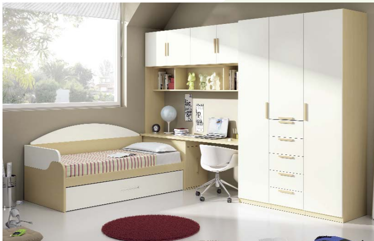
67. Completo dormitorio juvenil en chapa de madera, ideal para crear ambientes claros y espaciosos. Acabado en colores roble y blanco, con tirador en roble. Medidas: 249 x 362 cm. Armario 152 x 237 cm. Cama 90 x 190 cm.