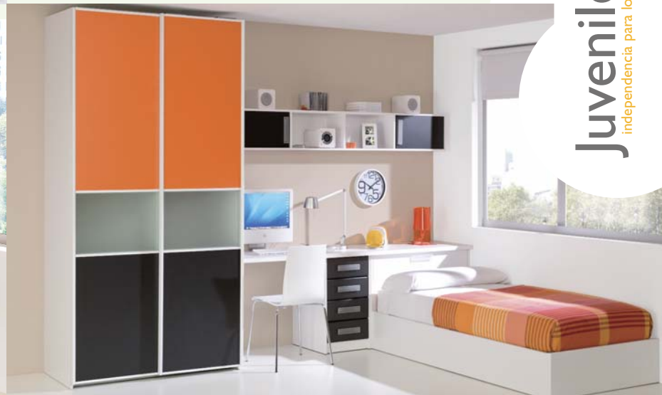
86. Completo dormitorio juvenil que consta de armario, mesa de estudio, cama y estantes con acabado en colores blanco, mandarina y pizarra. Medidas: 248 x 326 cm. Cama 90 x 190 cm.

Juveniles independencia para los más jóvenes